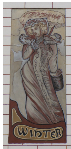
Peinture murale Gevelschilderij rue François Janssens-str. 5