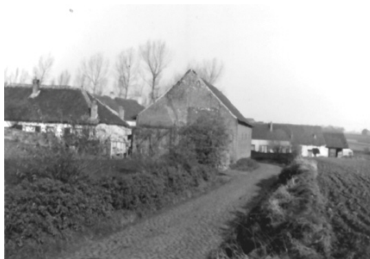
Photo d’un coin disparu de Neerpede (angle rue des Lapins – rue des Quarantaines) Foto van een verdwenen hoek van Neerpede (hoek Konijnenstraat – Zomerviolierenstraat)

Bijeenkomst : om 19.00 uur, “ Maison de la Laïcité d’Anderlecht ”, Veeweidestraat 38 te Anderlecht. Gratis toegang.