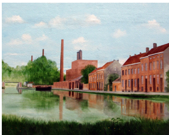
Une des vues de la fresque murale de Jean-Marc Collier, rue Victor Rauter – Een van de zichten van het fresco van Jean-Marc Collier, Victor Rauterstraat

Zaterdag 15 januari 2011 – Nieuwjaarsdrankje aangeboden door Anderlechtensia aan zijn leden, voorafgegaan door een korte rondleiding in het centrum van Anderlecht